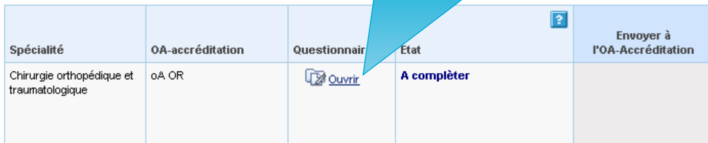
Le(s) questionnaire(s) d'auto-évaluation